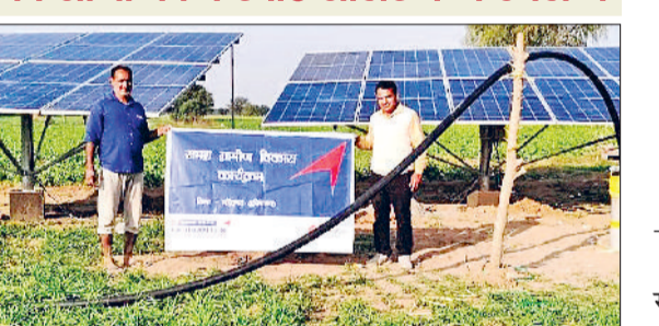
नारनौल। किसान को उपलब्ध करवाया सोलर वाटर पम्प।